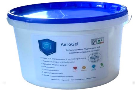
Einfach, zuverlässig und sicher. Aero Gel

Das revolutionäre Aero Gel , welches auf Grundlage der neuesten Erkenntnisse der Nanotechnologie entwickelt wurde, ist ein umfassendes, auf sich abgestimmtes System und liefert eine Lösung für mehrere Probleme. Die exklusive und patentierte Formulierung meistert die Herausforderung, durch Feuchtigkeitskontrolle die Entwicklung von Schimmel und schädlichen Mikroorganismen zu verhindern, die Energieeffizienz der Innenräume zu steigern und letztlich ein rundum gesundes Wohngefühl zu schaffen.